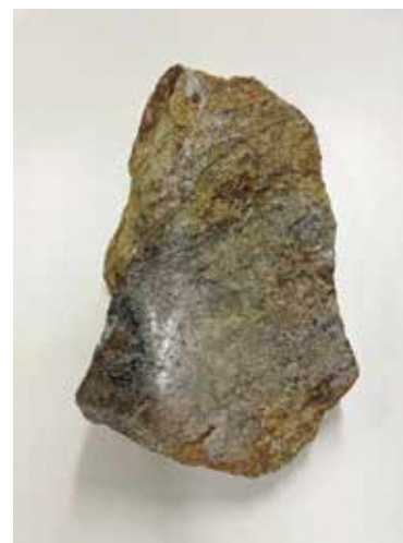
島根県津和野町 花崗片麻岩（日本最古の岩石）