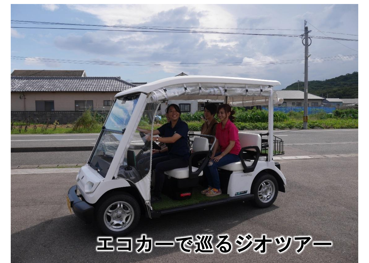
エコカーで巡るジオツアー