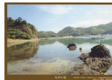
←島根町桂島 PR看板の設置