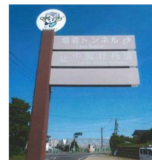
←八束町 案内看板の設置

※請求書は、交付決定後または交付確定後に提出してください。（口座振替依頼書を添付）