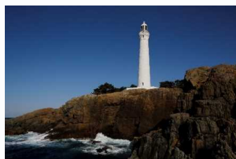
出雲日御碕灯台 (国指定有形文化財)