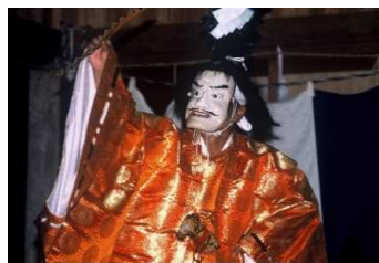
佐蛇神能 (国指定重要無形民俗文化財、ユネスコ無形文化遺産)