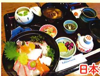
misaki cafe tatsuzawa 定員:20名様 定休日:水曜日 ※その他の休みは 店舗HPを確認 してください 日本海丼セット