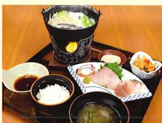
ぐるめ幸洋 定員:100名様 海の幸 鍋御膳