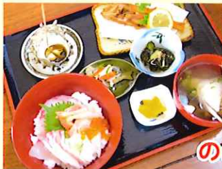
柿谷商店 定員:20名様 受付可能時間: 10:00～15:00 海鮮 のどぐろ定食