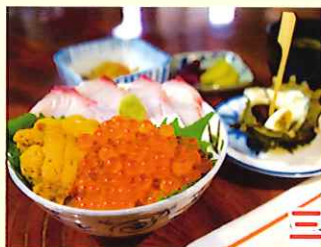
花房商店 定員:20名様 定休日:水曜日 ミニ海鮮 三色丼セット