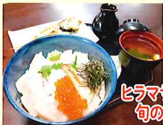
まの商店 定員:20名様 受付可能時間: 10:00～16:30 ヒラマサの海鮮丼と 旬の一品セット