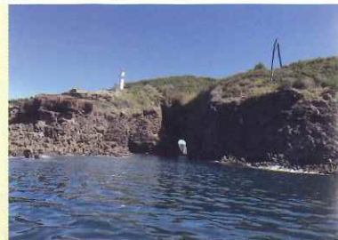
出雲国風土記の佐太大神の生誕地, 新潜戸

出雲神話や風土記が伝わる島根半島・宍道湖中海ジオパークは、太古の昔、日本がまだ大陸の一部だった頃から、大陸が分裂して日本海となり、現在のような日本列島が誕生した様子を知り、五感で体験できる貴重な場所です。