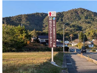
松江ビジターセンターへの誘導看板