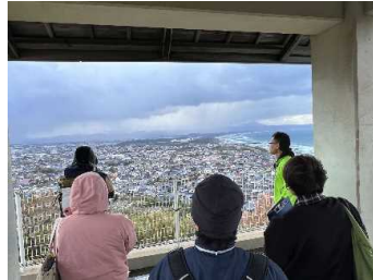
奉納山フィールドワーク