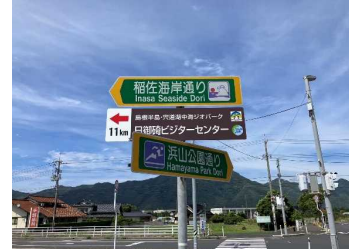
日御碕ビジターセンターへの誘導看板