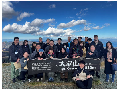
JGN 全国研修会 in 伊豆半島