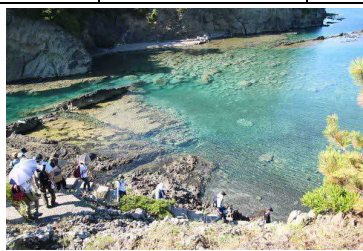
桂島フィールドワーク