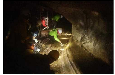
竜溪道洞フィールドワーク