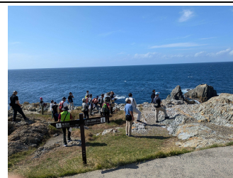
日御碕フィールドワーク