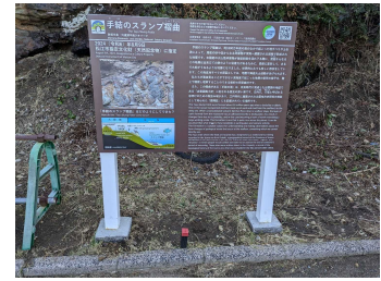
手結のスランプ褶曲看板