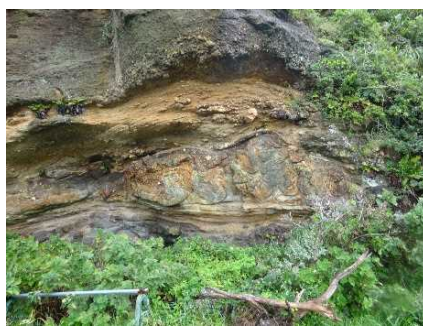
手結のスランプ褶曲