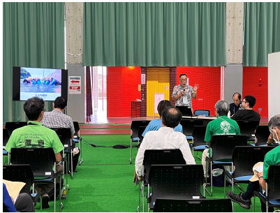
JGN 全国大会での召古ジオガイド の口頭発表