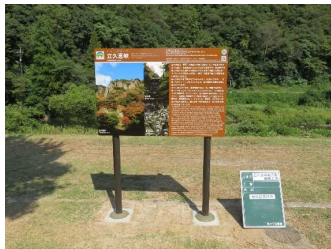
立久恵峡解説看板