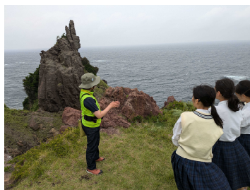
多古の石柱の視察