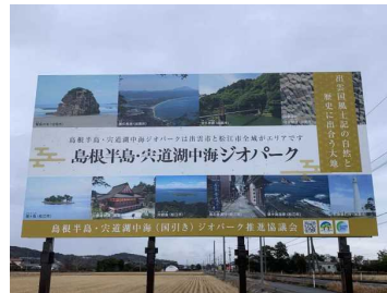
出雲市平田町設置看板のリニューアル