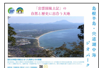
くにびきマラソン協賛広告