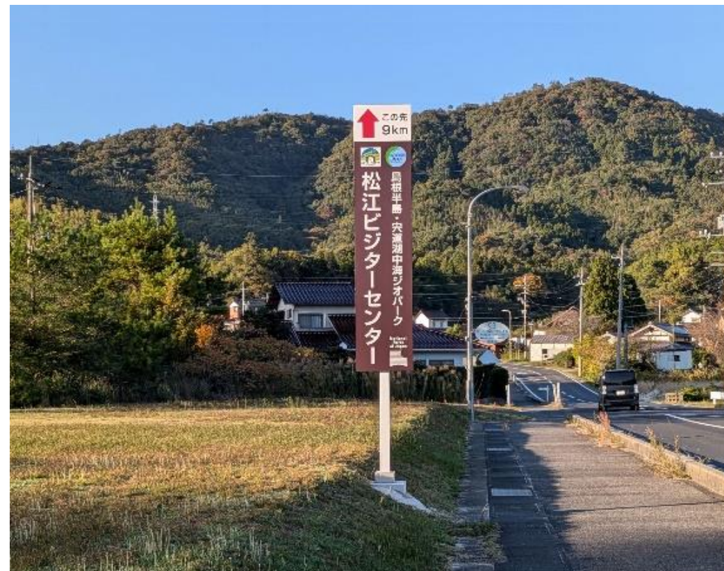
松江ビジターセンターへの誘導看板