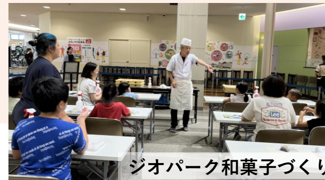
ジオパーク和菓子づくり