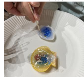
貝殻アクセサリー