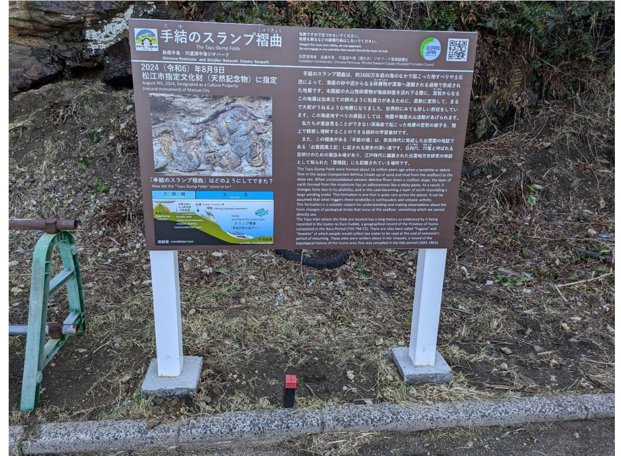
付近に説明看板を設置済