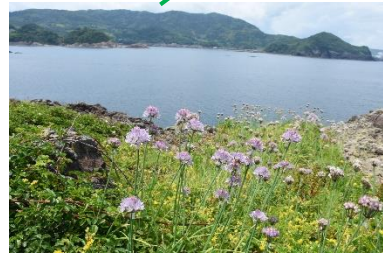
桂島のシロウマアサツキ