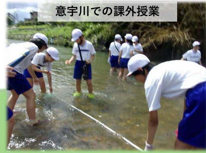
意宇川での課外授業