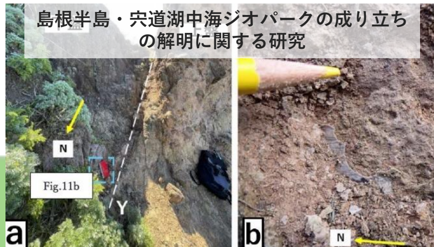
島根半島・宍道湖中海ジオパークの成り立ちの解明に関する研究