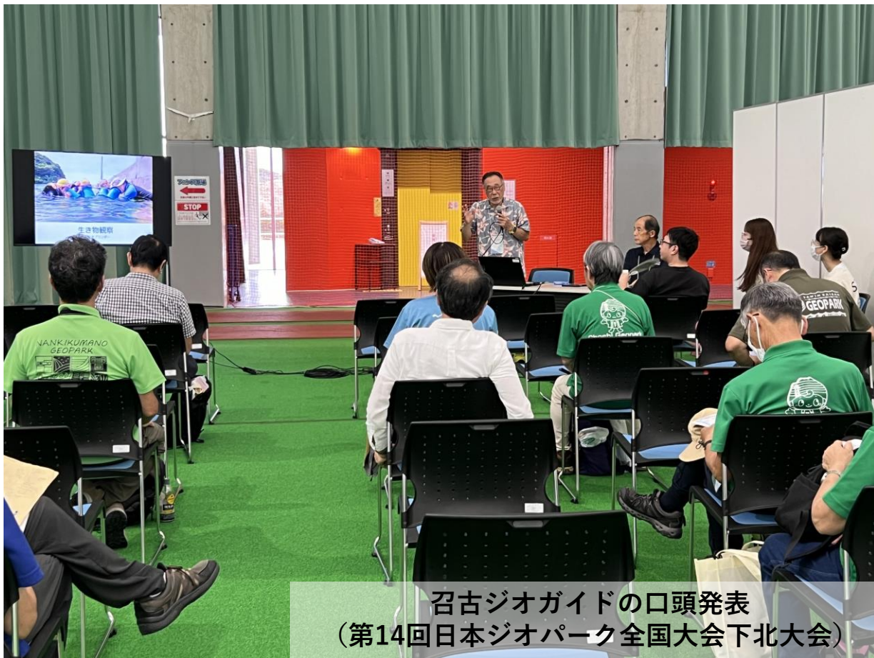
召古ジオガイドの口頭発表 (第14回日本ジオパーク全国大会下北大会)