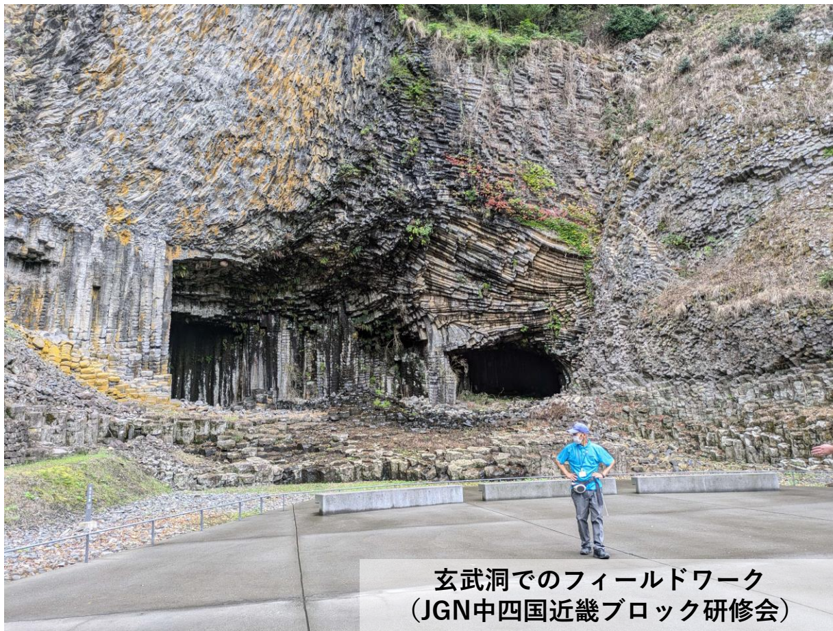
玄武洞でのフィールドワーク (JGN中四国近畿ブロック研修会)