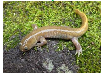
イズモオオサンショウウオ