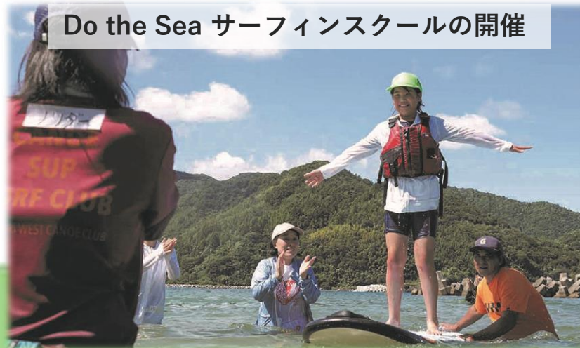
Do the Sea サーフィンスクールの開催