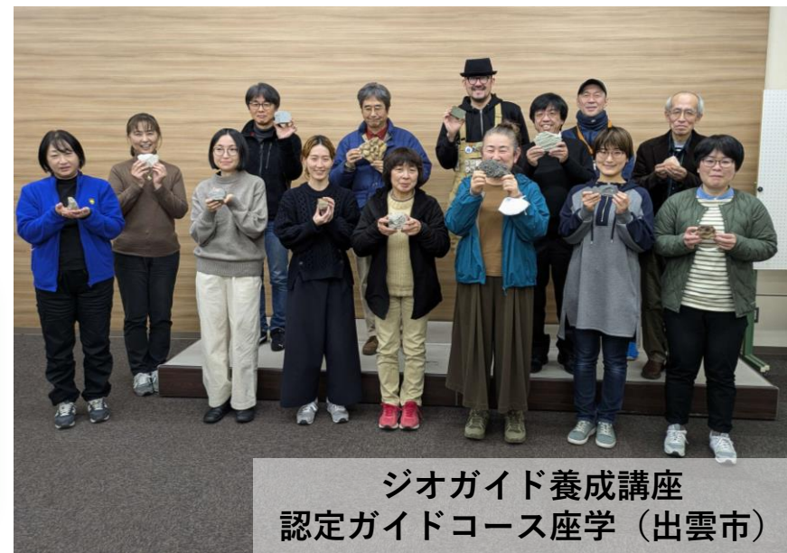
ジオガイド養成講座 認定ガイドコース座学（出雲市）