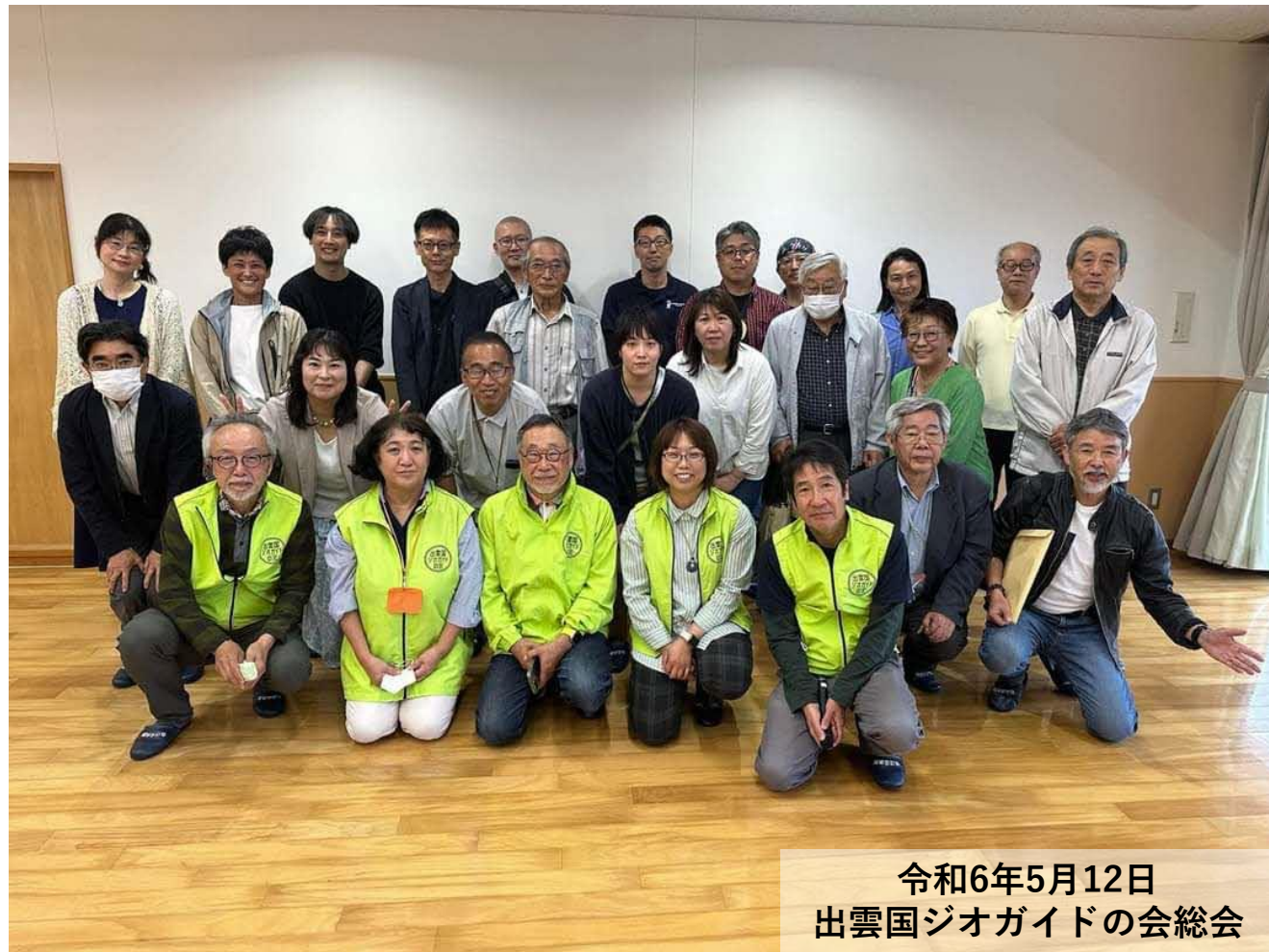
令和6年5月12日 出雲国ジオガイドの会総会