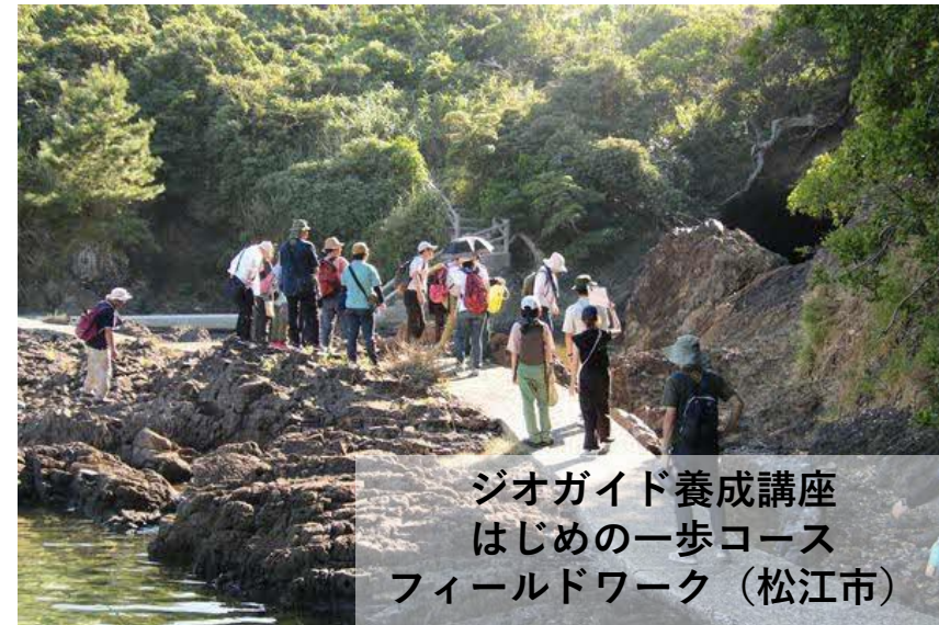
ジオガイド養成講座 はじめの一步コース フィールドワーク（松江市）