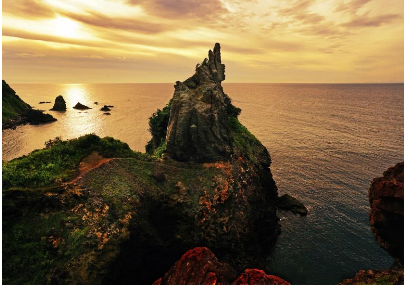
大地部門 最優秀賞作品 「悠久の孤高」