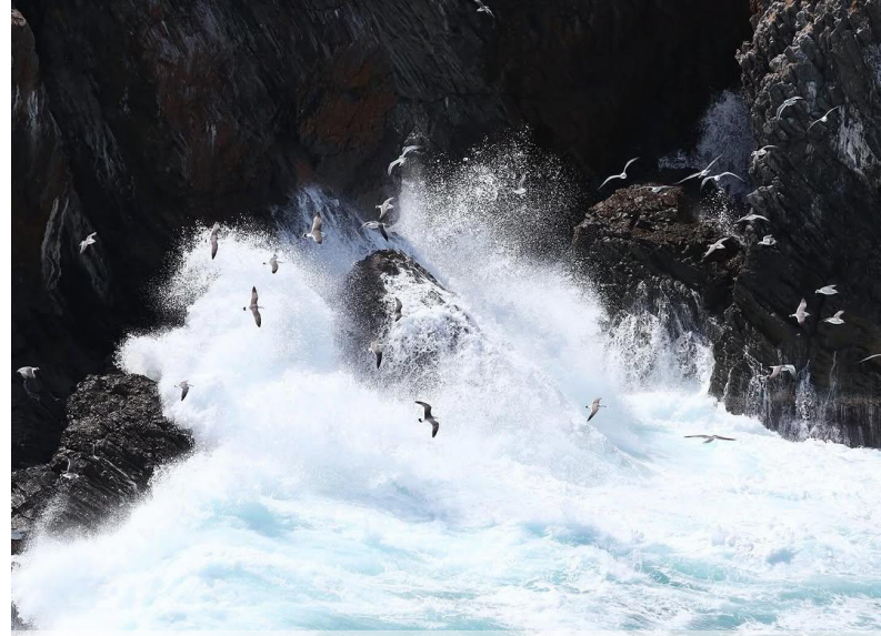
動植物部門 最優秀賞作品 「経島の宝物」