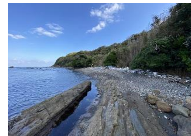
法田海岸の海食崖