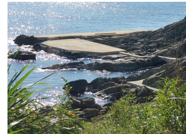
十六島砂泥互層観察コース