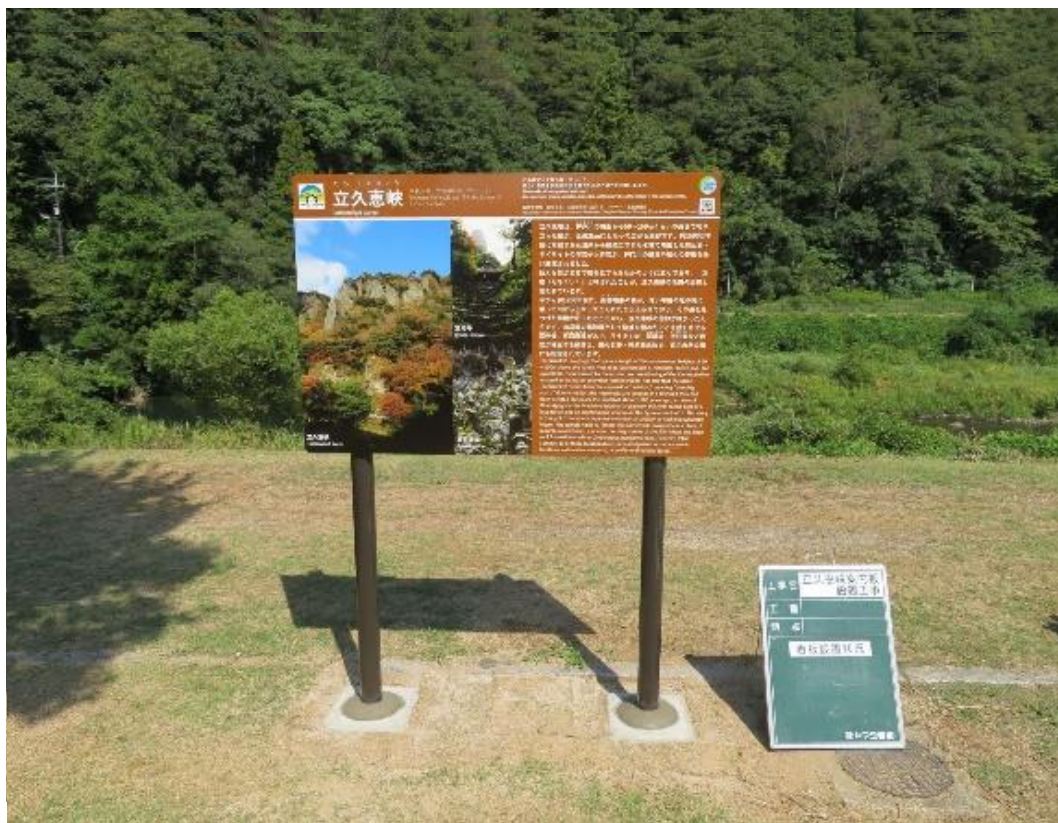
立久恵峡の解説看板