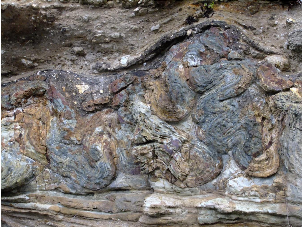
約1600万年前の海底で行った地すべりで生じた 特異な変形の地層