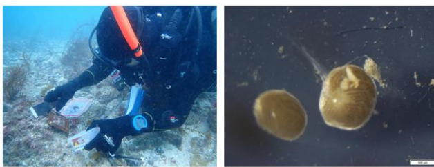
図：2025年2月12日における野波海岸での調査風景(左)および、採取した生体 A. lobifera の顕微鏡写真

(1) 2024年10月17日に、島根町野波海岸でスクーバ潜水による水深 26.9 m までの大型有孔虫調査を実施した。