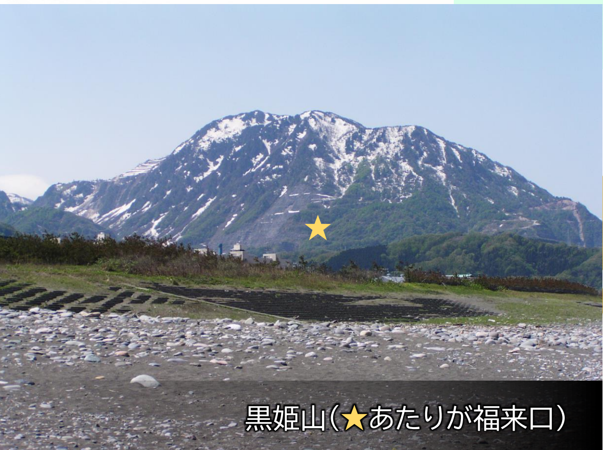
黒姫山(★あたりが福来口)