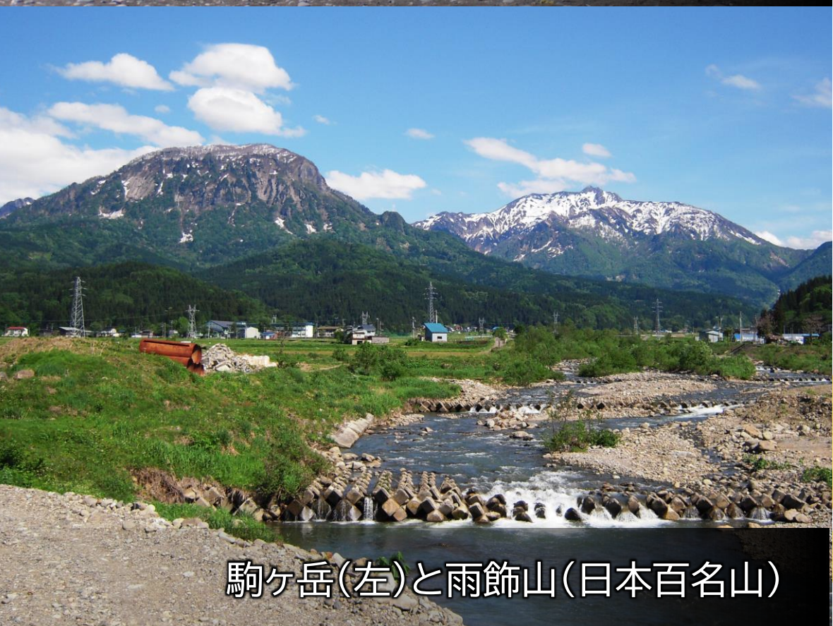
駒ヶ岳(左)と雨飾山(日本百名山)